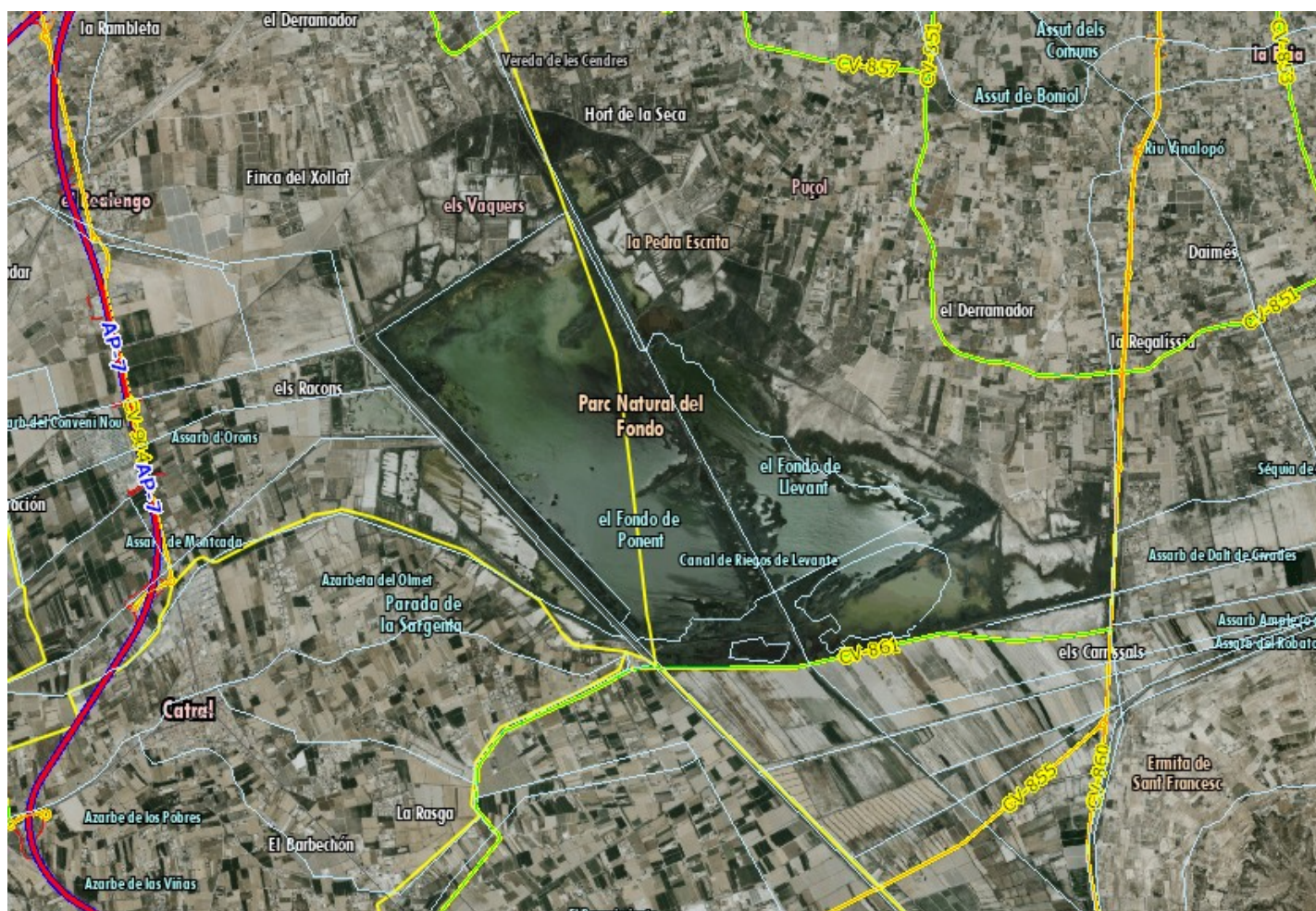
Imatge II. Ortofotografia aèria any 2019. Escala: 1:72.000

Destaca la CV-861 pertanyent a la diputació i perimetral a part del parc, i també els nombrosos canals de reg de diferents dimensions.